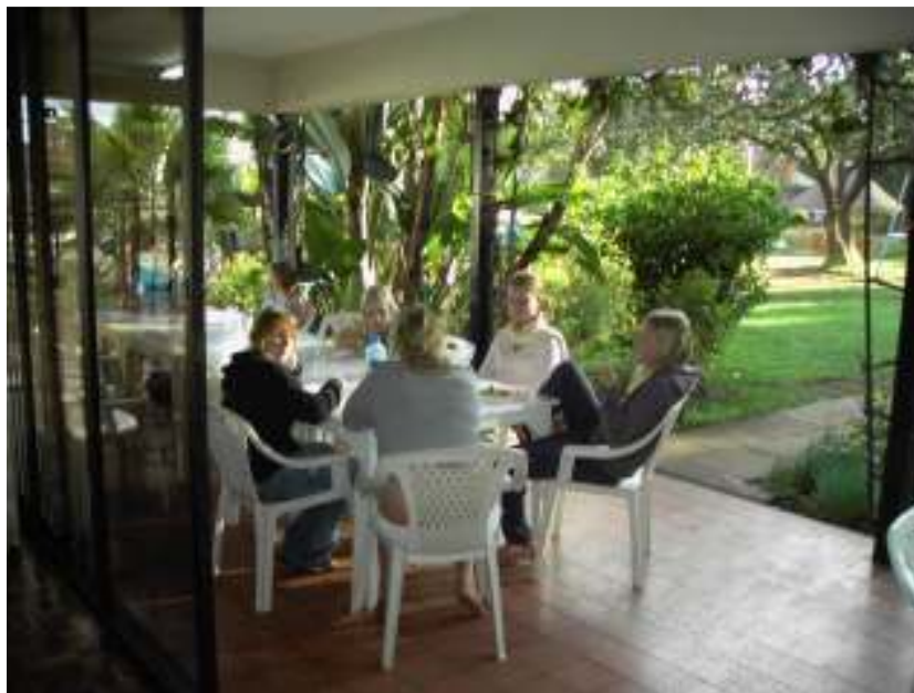
Middag utanför matsalen

Visst är det en stor omställning från hemmiljön men de flesta lär sig att stå på egna ben, bli självständiga och utvecklas positivt. De vuxna finns tillgängliga som hjälp och stöd.